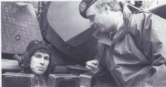
Russische journalist in NAVO-tank. Pagina 6.