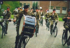
4 Het mobiele orkest. Waaroner niet staande op het hoofd met granaten jongleren!

tanks. Dit laatste was, zo leek mij, om te voorkomen dat ik in het donker m'n hoofd of m'n camera zou stoten. Als bloccote gaf men mij velletjes papier waarop aan de achterzijde betoonrijk geteilleerde staakarten waren afgedrukt. „En wij dachten dat er een groepje Russen zou komen!“ ziden de mij ontvengende militairen teleurgesteld. Ik denk dat als er een compagnie Russische journalisten gekomen was dit alles ook mogelijk zou zijn geweest. Ik vermoedde zelfs dat als ik uit het bos naar de soldaat van de wacht toe was gelopen en - uitlegend dat ik een Russische journalist was, simpelweg om een rondleiding verzocht had - maar even bij de slagboom had hooven te wachten. Mij werd echter beleefd uitgelegd dat dit niet zo was, aan mijn bezoek was onzichtbaar voorbereidend werk vooraafgegaan. En zo zie ik dus NAVO-tanks voor me, en dat zonder kippeval van angst te krijgen omdat er een met veel lawaai op me komt afgeraasd. Bovendien wandelt er in de buurt van het pleintje, waar de vlag aan de