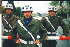
1 „Excuseer me jongens, maar ik ga nu schreeuwen.“