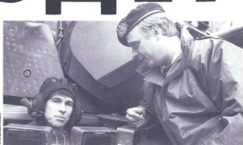
Russische journa- list in NAVO-tank. Pagina 6.